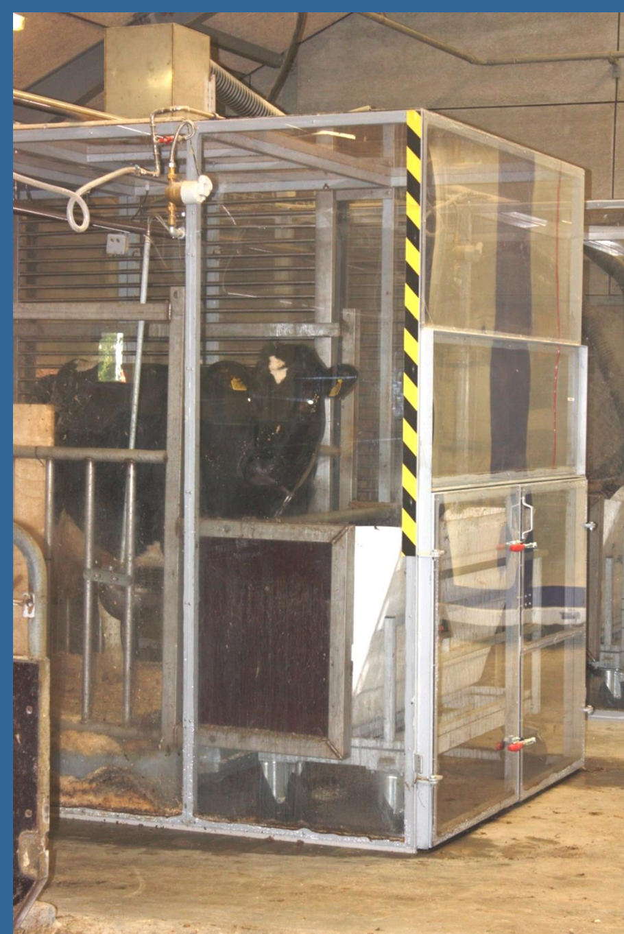
Metan L per kg TS optagelse

Ved at måle metan-koncentrationen i luften, kan vi beregne hvor meget metan, den enkelte ko udskiller. Nedsættelse af udledningen af metan er en win-win situation, da klimaet påvirkes mindre og koen bliver mere effektiv.