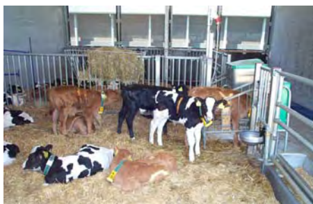
Kalvene har adgang til én mælkeautomat pr. gruppe.

Der ses øget drikke-hastighed og et højere niveau af aggression når der er 24 kalve pr. automat. Dette antyder, at kalvene er udsat for social belastning når der er 24 kalve frem for 12 kalve pr. automat.