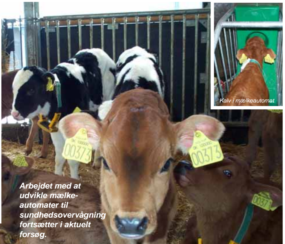
Kalv i mælkeautomat

På dage med sygdom har en kalv f. eks. færre forgæves besøg (dvs. besøg efter den har drukket sin ration) ved mælkeautomaten end på dage hvor den er rask. Derfor er antal forgæves besøg et godt bud på en indikator på sygdom.