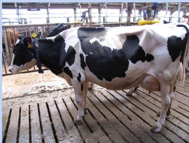
SDM køer kan give mere mælk, når de får to forskellige foderblandinger gennem laktationen, frem for én.

Til sammenligning blev en anden gruppe køer fodret med uændret foderration gennem hele laktationen, uanset vægt (TMR1-strategi). Alle rationer bestod af en grundration samt kraftfoder tildelt i robotten.